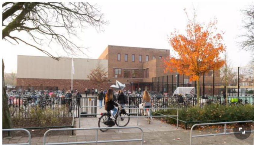
Het Hilfertsheem College in Hilversum is een van de scholen met een gezonde kantine - Hilfertsheem College

HILVERSUM - Er komen 'snackvrije zones' rondom Hilversumse middelbare scholen met een gezonde kantine. Daarmee wordt het verboden om op schooldagen tot 250 meter van de school eten en drinken te verkopen. Dat heeft de gemeente Hilversum besloten.